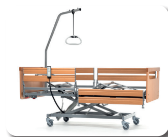
En option barres latérales divisées en hêtre