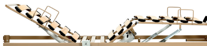
Lattes en bois