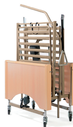
Livré sur Kit de transport