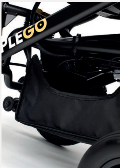
B64 SAC DE RANGEMENT SOUS LE SIÈGE