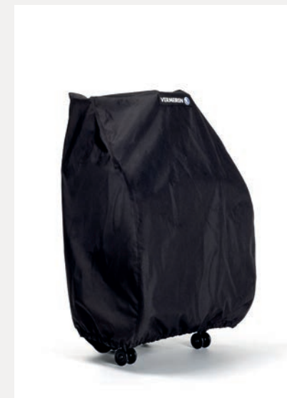
ESE45 HOUSSE DE RANGEMENT