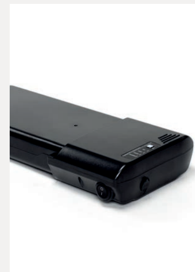
BATTERIE SUPPLÉMENTAIRE 12,8 AH OU 17,5 AH

Pour répondre à une large gamme de préférences et de besoins, nous proposons plusieurs options pour votre Plego. Rangez votre Plego ou ajoutez des fonctionnalités supplémentaires pour convenir à vous et à vos besoins.