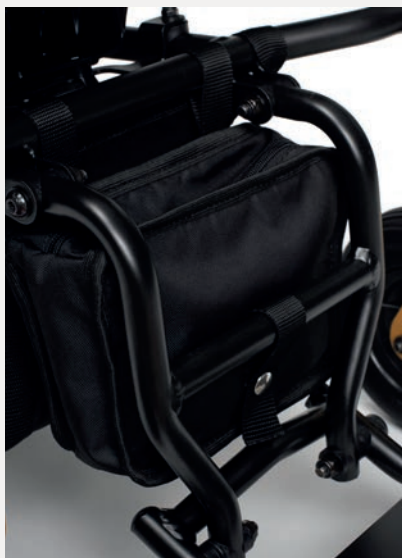
B63 SAC DE RANGEMENT DERRIÈRE LE REPOSE-PIEDS