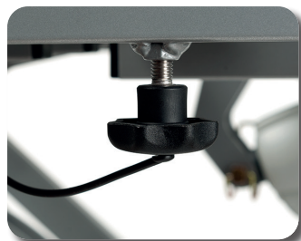
Einfache Montage und Demontage